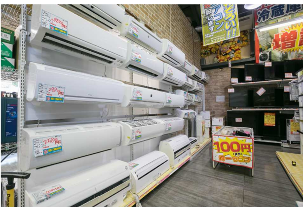
エコプラス小倉南店