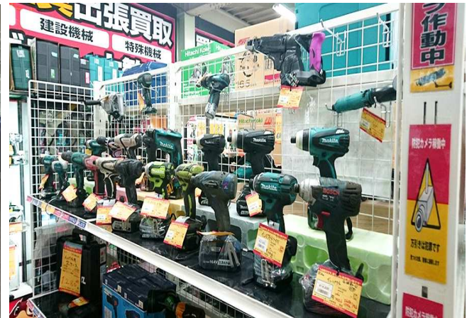
ハンズクラフト博多店