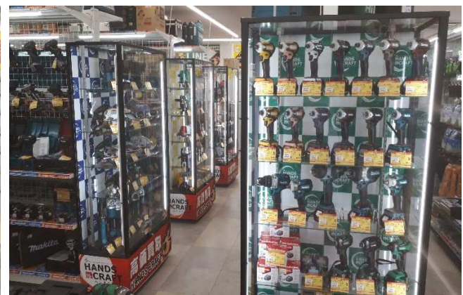
ハンズクラフト福岡インター店