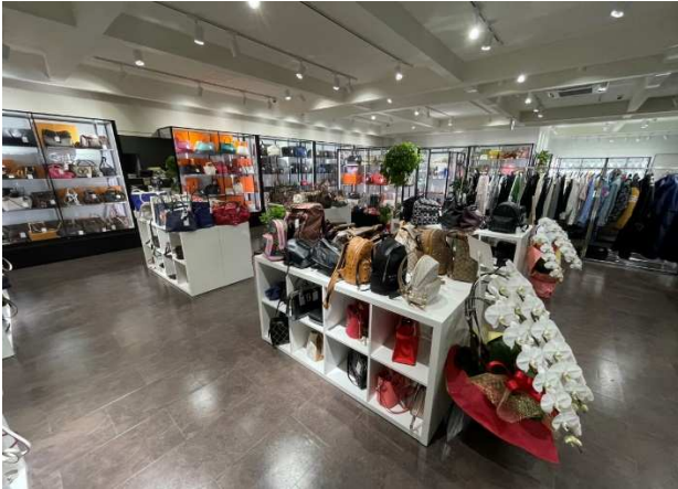
エコプラス小倉本店